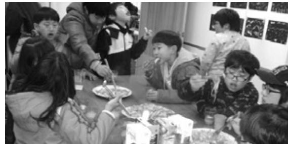
<22기 2012. 1. 11~6. 27(8개 기관 선정)> 경기지역 : 생원지역아동센터, 동안지역아동센터, 드림지역아동센터 전북지역 : 하늘땅지역아동센터, 열린지역아동센터, 한마음지역아동센터, 다아슴지역아동센터, 고창지역아동센터

2001년부터 시작된 사랑의 간식 나누기는 대한항공과 아시아나의 후원으로 국제선에서 개봉되지 않은 주스와 간식거리를 모아 6개월씩 지역아동센터에 지원하고 있는 나눔사업이다. 2012년 상반기 동안 8개 기관을 선정해 간식을 지원하고 있다. 2011년 하반기 동안에는 10개 기관에 간식을 지원했으며 비정기적으로 급식에 사용할 수 있는 양념류와 떡, 국수 등을 추가로 지원했다.