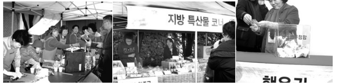
2011 사랑나누기 바자 한마당에 참여해주신 모든 후원자님께 감사 드립니다