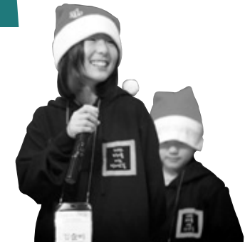
미래를 여는 영어교실은